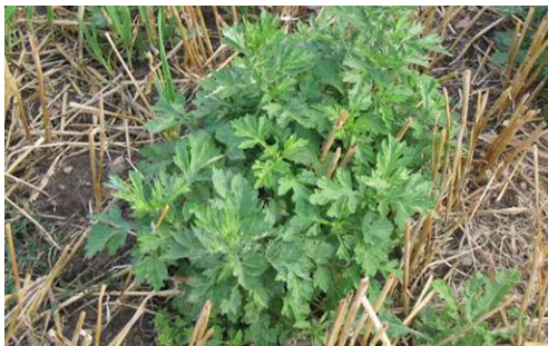
Billede 1. Glyphosat har høj effekt på grå bynke i god vækst.

Det korteste interval gælder under gode temperaturforhold og høj lysindstråling.